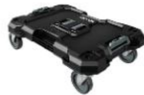
DSP701 四輪滑車 251265 牌價 $ 2,800