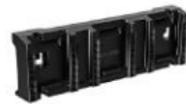
DSP601 電池掛架 251285 牌價 $ 600