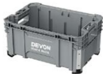
DSP104 提籃箱 251259 牌價 $ 2,000