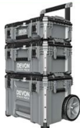
DSPK101-3 三合一堆疊箱 250911 牌價 $ 9,950