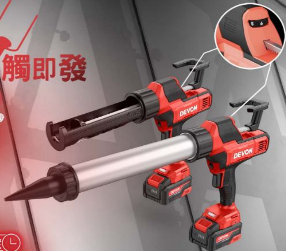
6002-Li-20 鋰電矽利康槍 6003-Li-20 鋰電矽利康槍