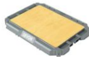
DSP401 工作面板 251264 牌價 $ 1,650