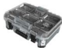
DSP302 零件整理盒 251258 牌價 $ 1,400