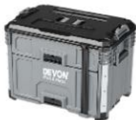
DSP106 二抽抽屜箱 251261 牌價 $ 5,000