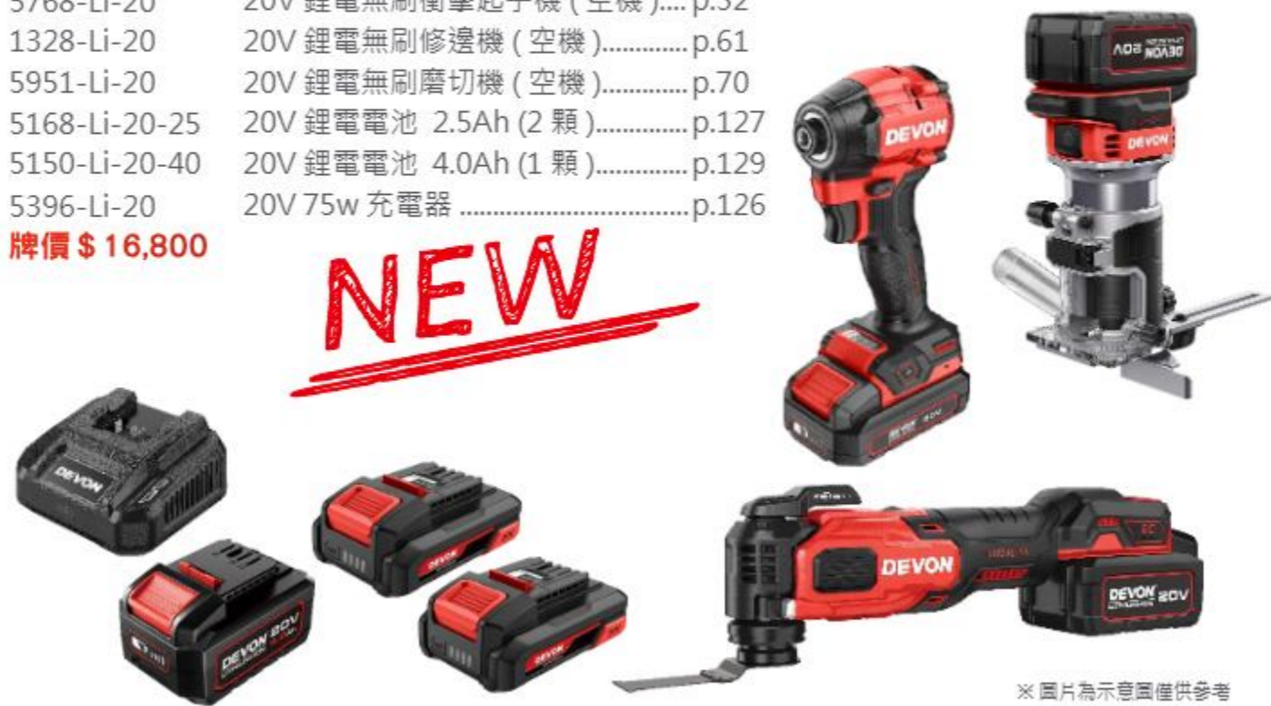
※ 圖片為示意圖僅供參考