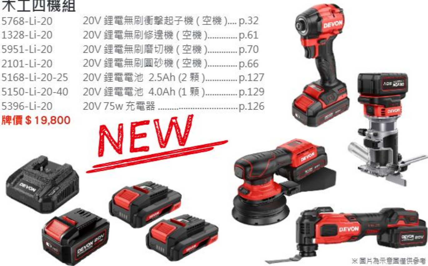
※ 圖片為示意圖僅供參考