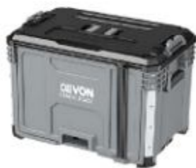
DSP107 翻櫃抽屜箱 251262 牌價 $ 4,600