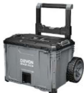
DSP108 滾輪抽屜箱 251263 牌價 $ 6,800