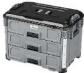
DSP105 三抽抽屜箱 251260 牌價 $ 5,600